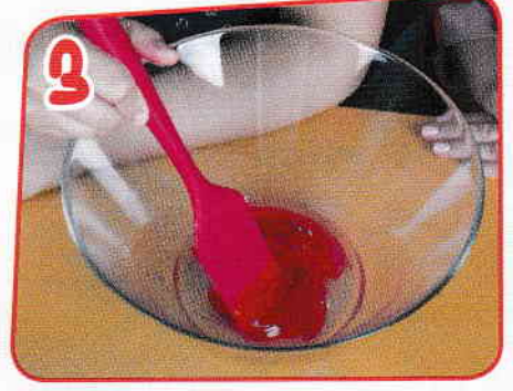
3 Se amestecă bine.