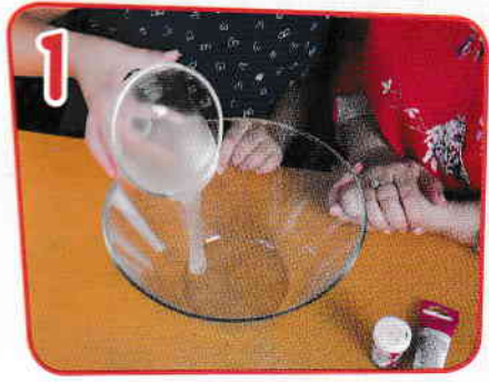
1 Se toarnă masca de față peel-off într-un bol.