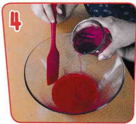
4 Se adaugă puțin câte puțin detergentul lichid.