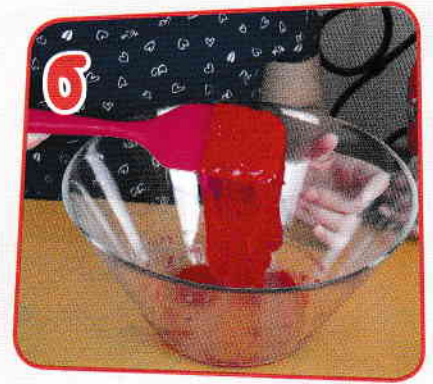
6 Se obține astfel o substanță vâscoasă.