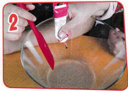
2 Se colorează cu colorant alimentar roșu.