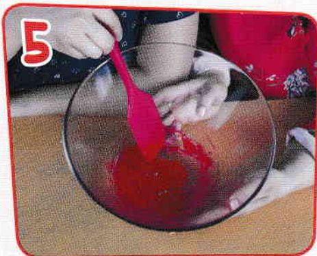
5 Se amestecă bine. Dacă e nevoie, mai adaugă detergent.